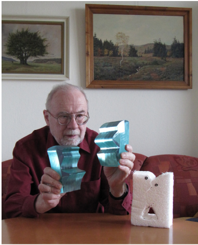
Mit Bauteilen zum Objekt „Konfrontation“